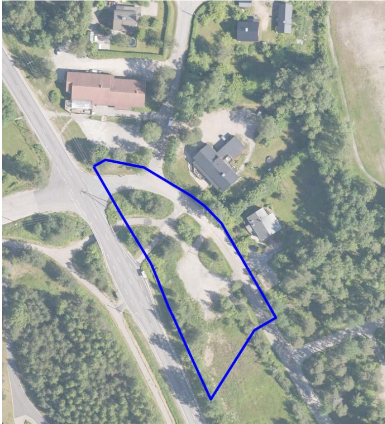
Suunnittelualue ympäristöineen. Ilmakuva © Blom 2015.

Suunnittelualue on kooltaan 3 979 m 2 . Se sijaitsee Märynummen taajamassa Vaskiontien ja Opinahjontien risteyksen tuntumassa. Suunnittelualueelta on matkaa Halikon kirkokylään noin viisi kilometriä ja Salon keskustaajamaan noin 8,5 kilometriä. Suunnittelualue on pääosin Salon kaupungin omistamaa. Valtio omistaa maantien alueen ja yksityinen maanomistaja suunnittelualueen pohjoisnurkan. Suunnittelualueen ja lähiympäristön maanomistus käy ilmi liitteestä 2.