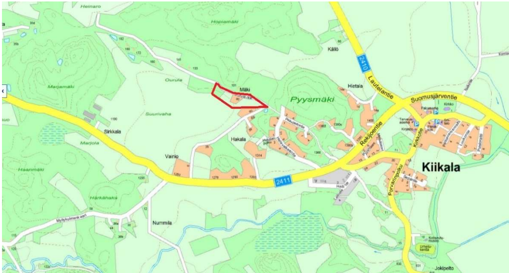
Kaava-alueen alustava rajaus punaisella, © Salon kaupunki

Ourulantien asemakaavan muutosalue sijaitsee Kiikalan taajamassa. Asemakaavan muutos koskee kiinteistöä 734-704-2-128 ja muutosalue on pinta-alaltaan n. 2.4 hehtaaria. Rakennuspaikalla on asuinrakennus, autotalli sekä maatalousvarastorakennus. Kiinteistöllä ei ole tiedossa olevia suojelukohteita tai – alueita.