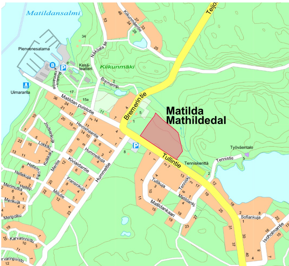
Sijaintikartta © Salon kaupunki

Asemakaavan muutos koskee kiinteistöä 734-555-3-326, Tammipuisto. Suunnittelualue sijaitsee Mathildedalin keskustassa Tullintien varrella. Pohjoispuolella alue rajautuu Teijon kansallispuistoon. Alue on kooltaan noin 3,1 hehtaaria.