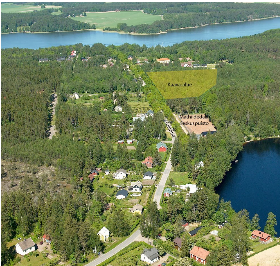
Ilmakuva alueesta. Kaavamuutoksen alue on merkitty keltaisella.

Alueen vieressä on Matildan keskuspuisto, jossa on adventure golfrata, tennis- ja padelkentät ja niihin liittyvä palvelurakennus. Salon seudun maakuntakaavassa alue on osoitettu merkittäväksi rakennetun ympäristön aluekokonaisuudeksi, Mathildedalin teollisuusmiljö. Alue rajautuu pohjoisessa lähivirkistysalueeseen (Teijon kansallispuisto), jolla ympäristö tulee säilyttää. Suunnittelualan länsipuolella on asemakaavassa osoitettu kylän ohittava yleisen tien varaus.