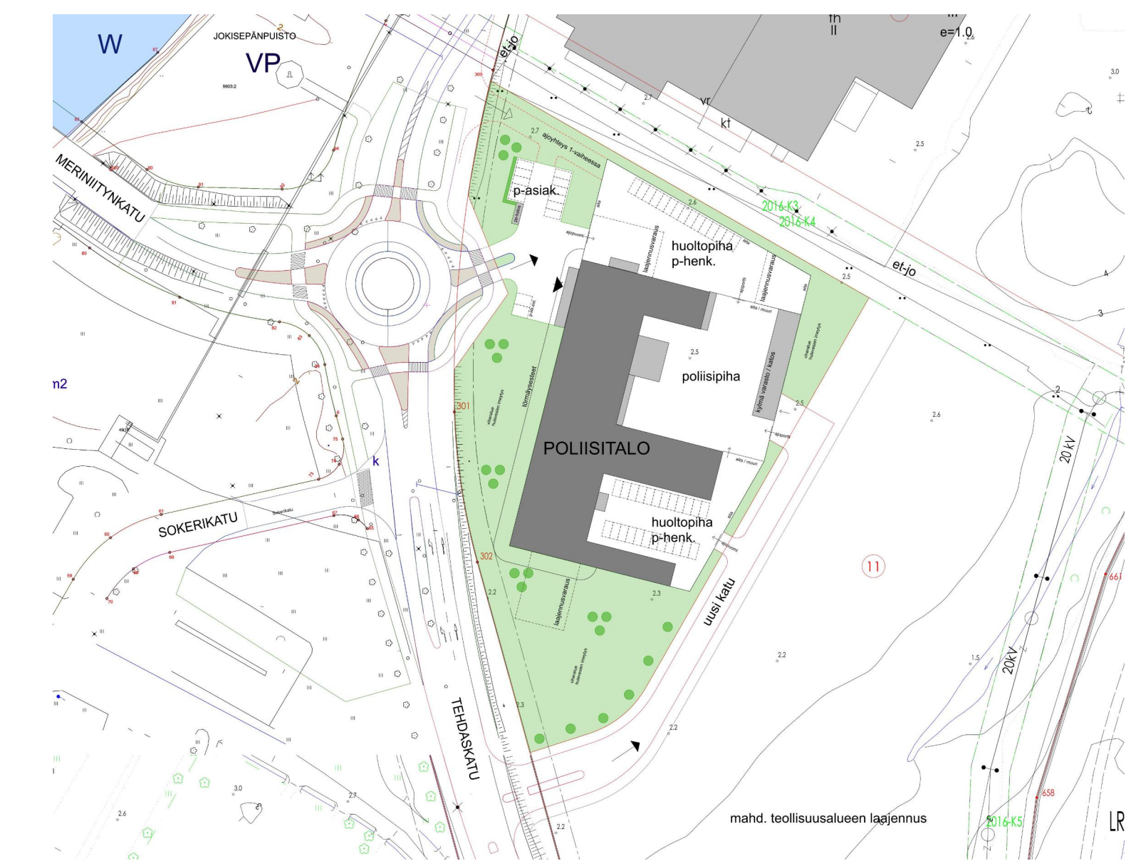
Tonttisivitus © Arkkitehtitoimisto Rosberg Ikävalko Oy