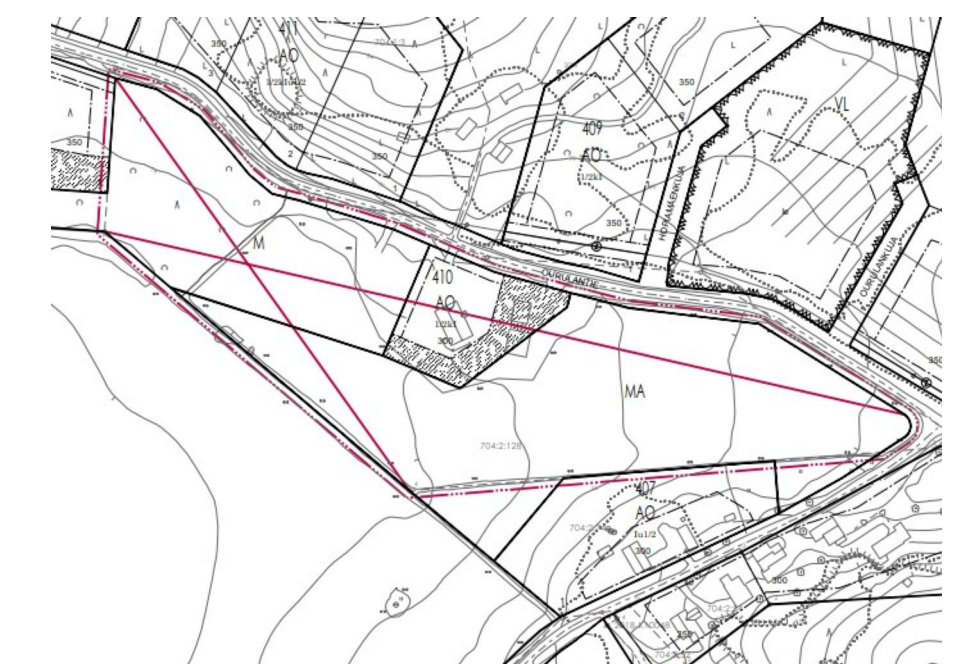
Poistuva kaava © Salon kaupunki ja MML, 2022

TÄMÄN ASEMAKAAVA-ALUEEN TONTTIJAKO ON OHJEELLINEN.