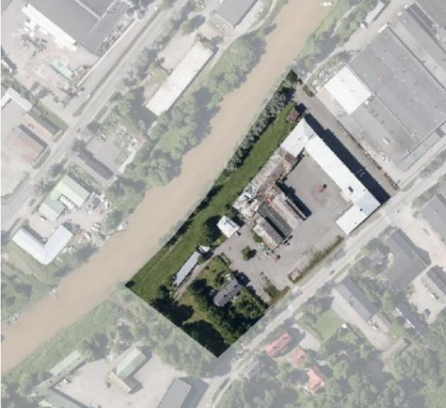
Ilmakuva kaava-alueesta.

Kaavoitettava alue sijaitsee Salon keskustan tuntumassa Hornin (2) kaupunginosassa Salonjoen varressa. Suunnittelualueella on Koulukaluston korttelin 10, tontit 7 ja 8. Alueen koko on noin 2,3 ha. Aluetta rajaa kaakosta Tehdaskatu ja koillisesta Kaivokatu. Lounaasta alue rajautuu vähäjoen uomaan ja luoteesta Salonjokeen. Kortteli sijaitsee noin 500 metrin päässä rautatieasemalta itään päin. Suunnittelualueen luoteisosassa on Itärannan puistoalue. Puistoalue on jäänyt vähälle hoidolle. Alueella on lähinnä nurmea ja vapaasti kasvavaa niittyä. Salonjoen varressa kasvaa rivissä joitakin hopeapajuja.