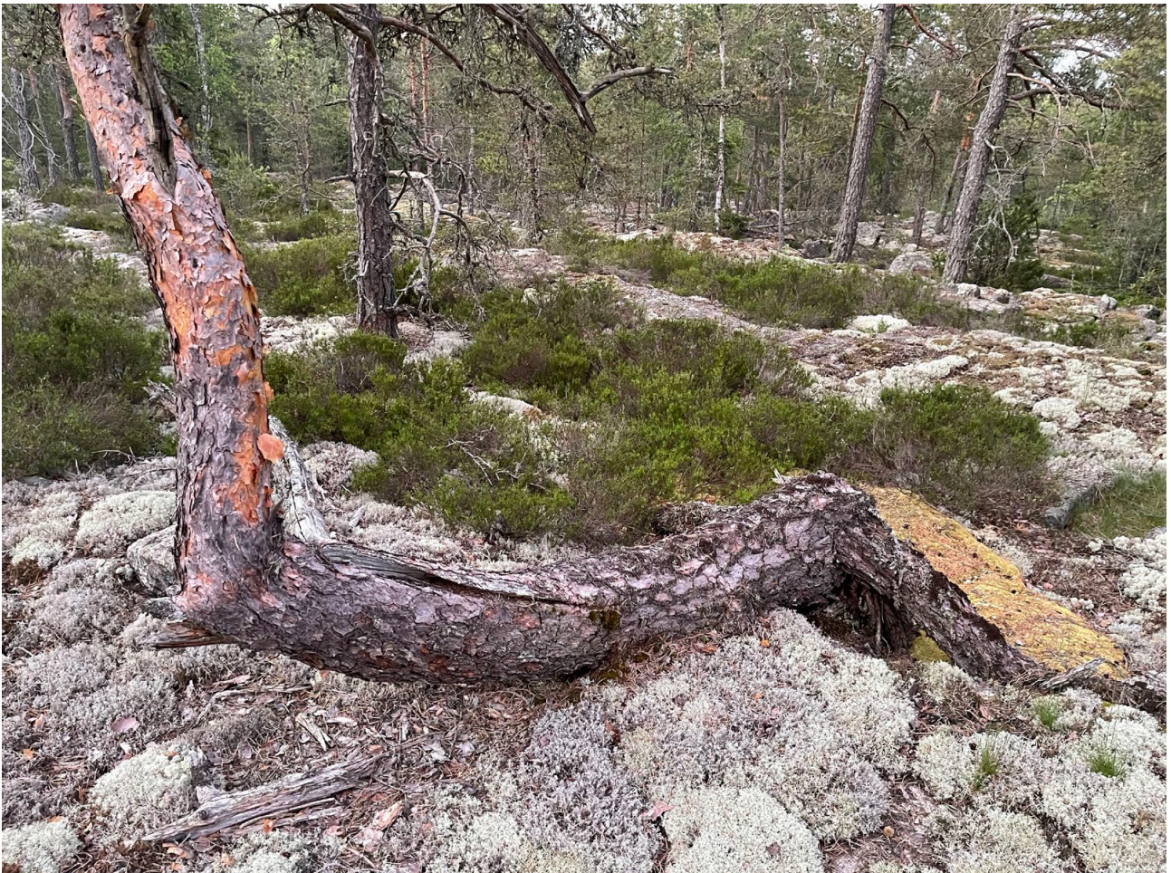
Kuva 7. Kirakanjärven kalliomänniköitä.

Pesimälinnusto on niukka johtuen karuista luontotyyppistä, mutta lajisto on laajemmalla alueella monipuolinen johtuen järvistä ja eteläpuolella myös maatalousmaisemista. Erityisiä linnustolle tärkeitä alueita ei selvityskohteelta voida esittää, mutta alueen säilyttäminen puustoisena em. laki- ja huomiokohteet säästävät linnusto ja muu lajisto hyötyy kohteiden huomioimisesta kaikessa maankäytössä.