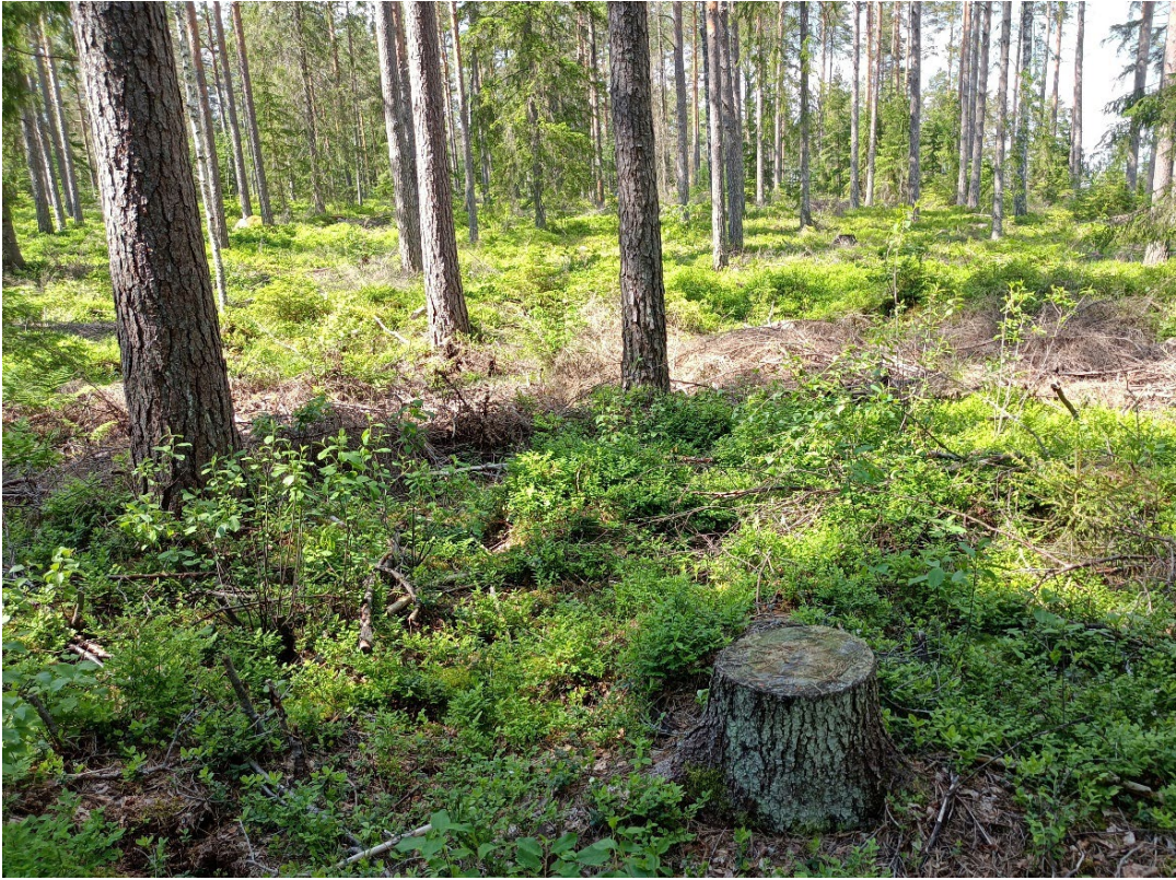
Kuva 3. Selvityskohteen metsät ovat normaalissa talouskäytössä.

Selvityskohteen metsät ovat normaalissa talouskäytössä, joten metsiköitä on mm. harvennushakattu ( kuva 3 ). Suuri osa metsikkökuvioista on tuoreen kankaan mänty-kuusisekametsiä tai kuivahkon kankaan melko mäntyvaltaisia metsiköitä, joiden ikä on noin 50–60 vuotta. Ainakin kohteen kaakkoisosassa on laajalti myös kuivaa ja kallioista männikköä, jonka alus- ja pohjakerrosta hallitsevat kanerva ja poronjäkälät. Vanhimpia, noin 80–100-vuotiaita, mäntyjä löytyy aivan selvitysalueen luoteisrajan kumpareiselta kankaalta. Järven rannan kallioisen niemekkeen lounaispuolella on puolestaan kostealla ojitetulla maalla noin 20-vuotiasta kuusitaimikkoa.