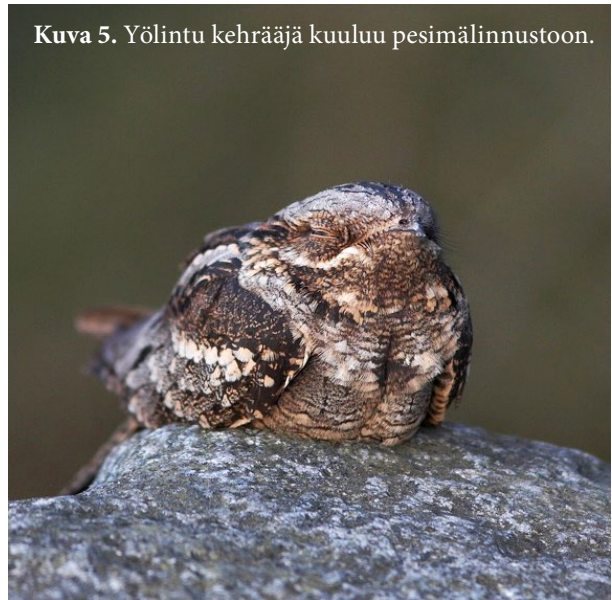
Kuva 5. Yölintu kehrääjä kuuluu pesimälinnustoon.

Päiväperhosista tavattiin mm. kolme ritariperhosta, kaaliperhosia, hopeätäplä (pienikokoinen lajilleen määrittämätön) ja nokkosperhosia.