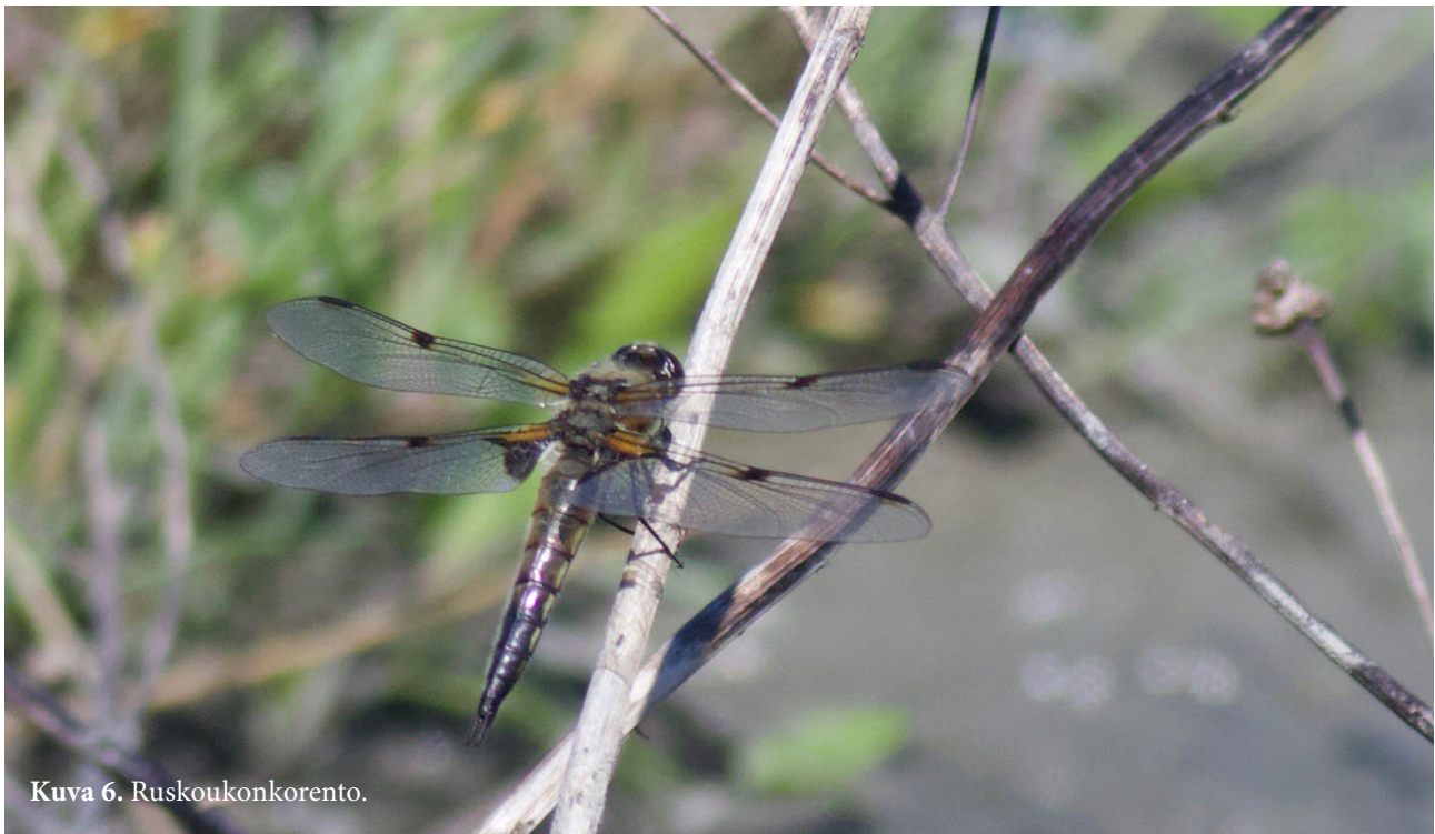
Kuva 6. Ruskoukkokorento.