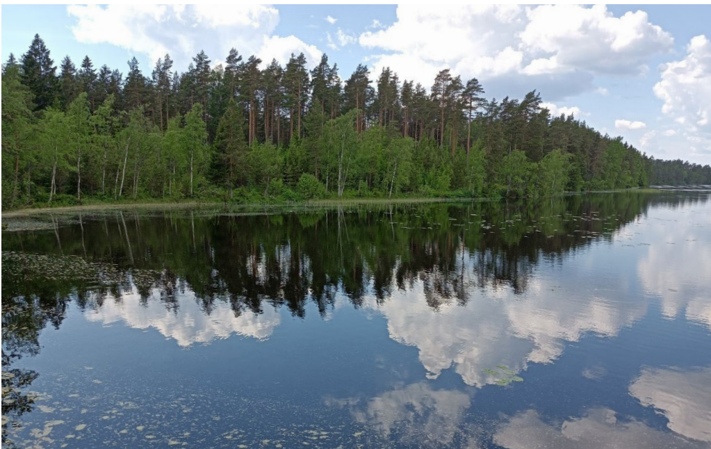
Kuva 2. Selvityskohteen metsäistä rantaa.

Selvitysalueen rajaus käy ilmi karttakuvasta (kuva 1). Kohde on metsäistä aluetta, jossa korkeusvaihtelut eivät ole mainittavan suuria. Tarkasteltavan alueen kaakkoisosassa on laakea, harvapuustoinen ja kalliainen alue, mutta kovin korkealle maasto ei kohoa. Talousmetsät ovat myös virkistys- ja metsästyskäytössä.