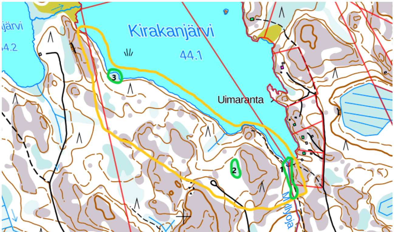
Kuva 1. Selvitysalueen rajaus (keltaisella) ja huomiokohteet (vihreällä).