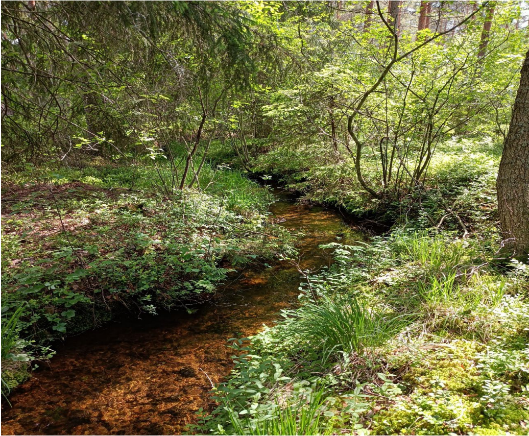
Kuva 4. Myllyojalla on melko hyvä luonnontila selvitysalueella.