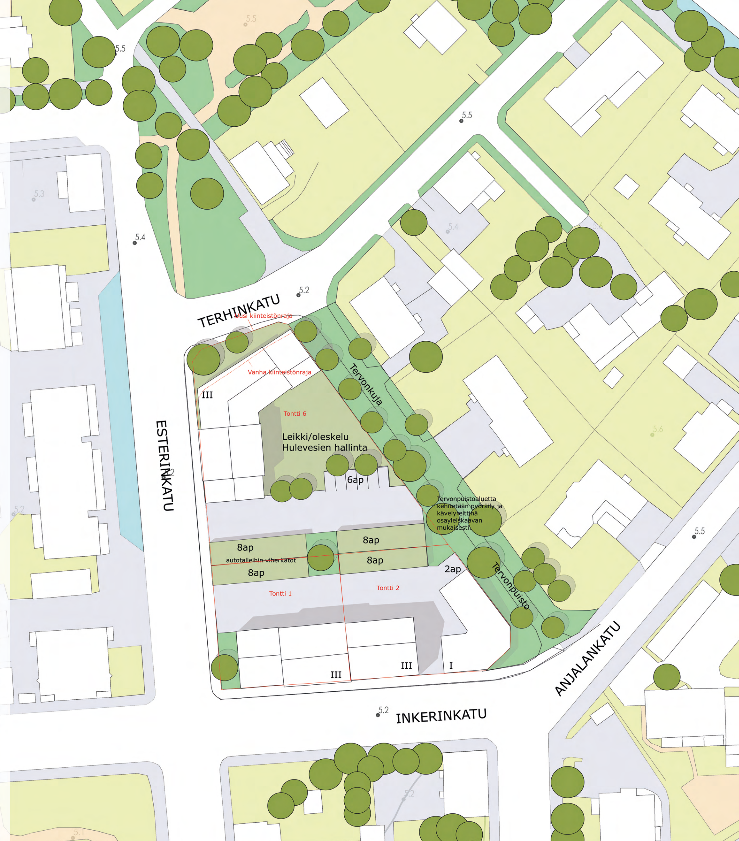
Asemapiirros luonnos 1:500 @Salon kaupunki