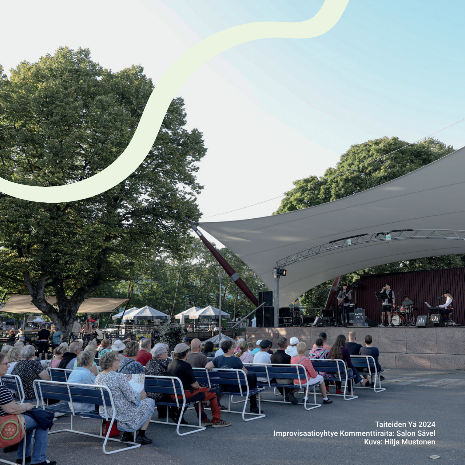
Taiteiden Yä 2024 Improvisaatioyhtye Kommenttiraita: Salon Sävel