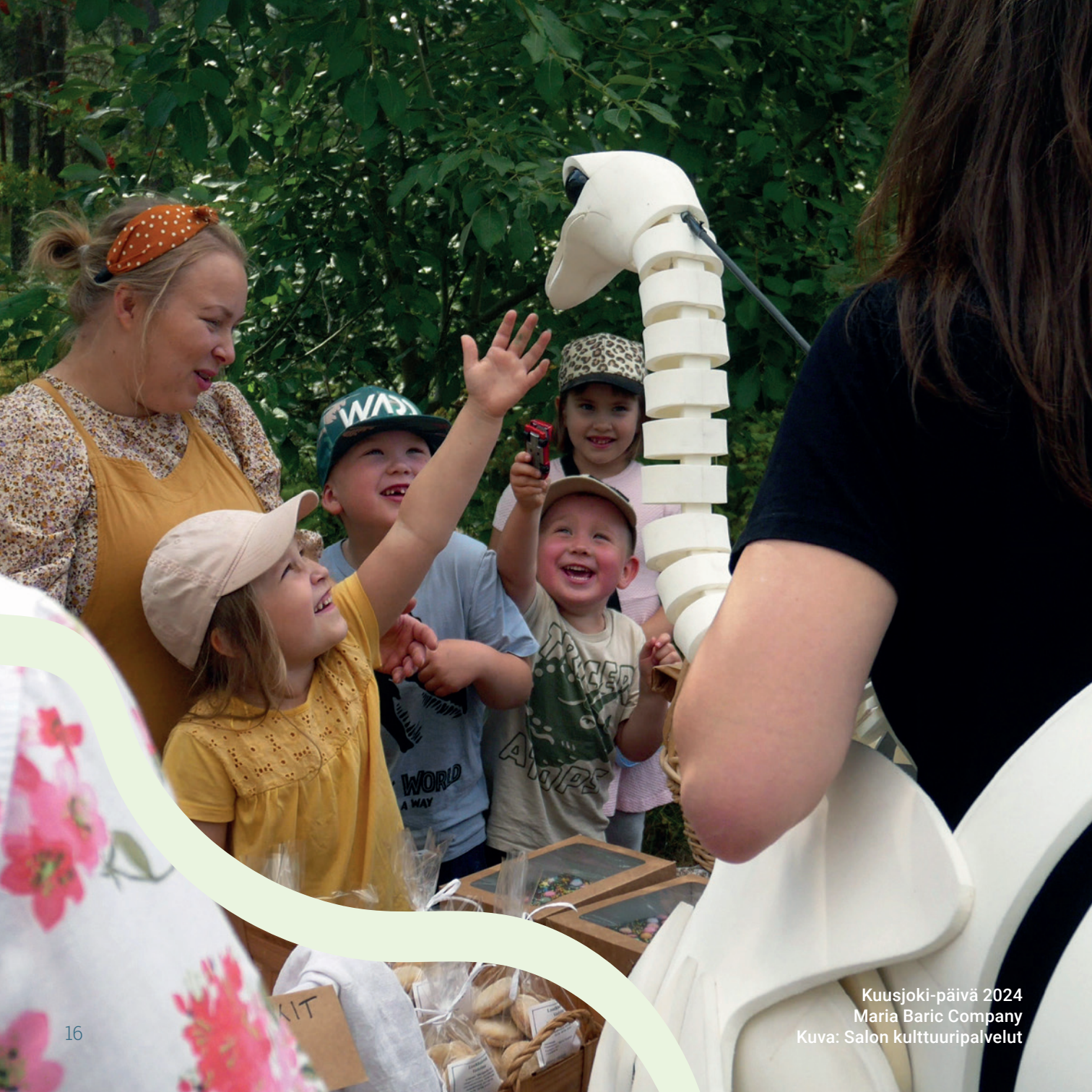
Kuusjoki-päivä 2024 Maria Baric Company