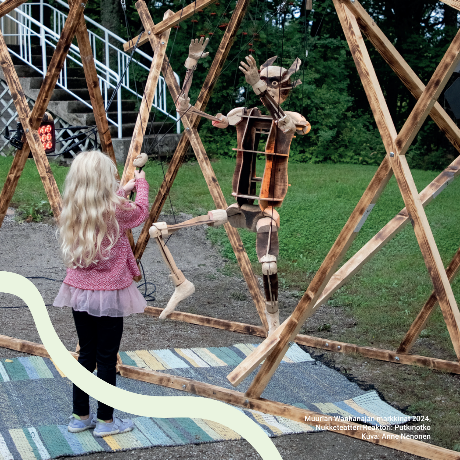
Muurlan Wanhajan markkinat 2024, Nukketeatteri Reaktori: Putkinotko