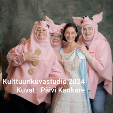
Kulttuurikuvastudio 2024