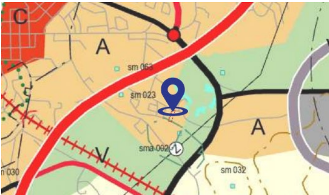
Varsinais-Suomen maakuntakaavayhdistelmä. 2021.

Suunnittelumääräys: Alueen kehittämistä tulee edistää johdonmukaisella suunnittelulla ja kaavoituksella olevaa yhdyskuntarakennetta täydentäen. Alueen maankäytön kehittämisen, liikenteellisten ratkaisujen ja palvelujen yhteensovittamisen tulee olla taajamakuvaan eheyttävää ja taajamakuvaalliset ominaispiirteet huomioivaa.