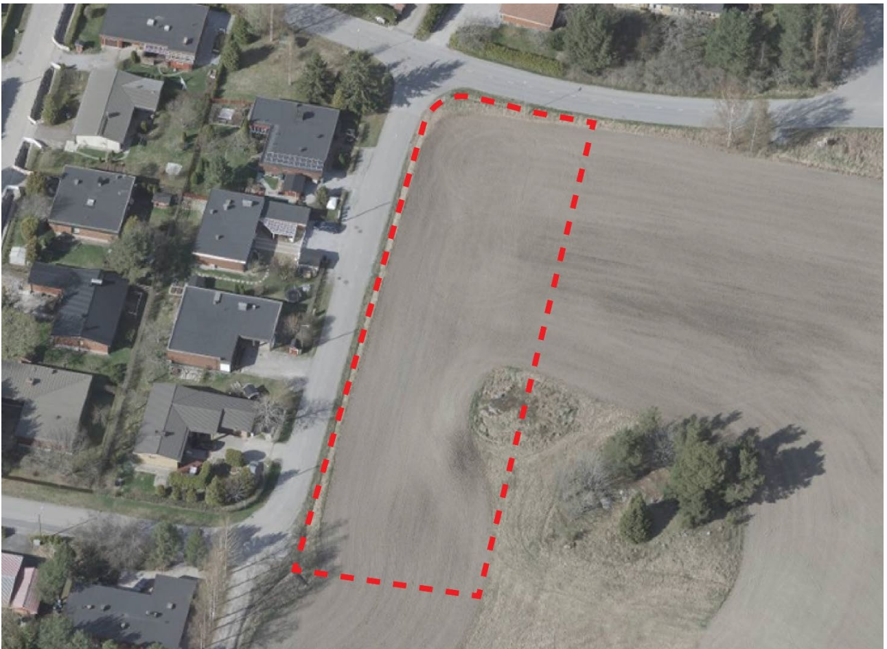
Viistoilmakuva etelästä. Mapspace. 2023.

Suunnittelualue on pääosin viljelysmaata. Alueen itälaidalla pieni osa on avokalliota. Alueen länsilaidan välittömässä läheisyydessä on syvä oja ja kadun toiselle puolelle sijoittuu tiiviisti rakennettua erillispientaloaluetta. Pientalot ovat yksikerroksisia ja alue on rakentunut 70-80-luvuilla. Suunnittelualueen pohjoispuolen rinteeseen sijoittuu väljemmin sommiteltuja yksikerroksisia erillispientaloja, jotka ovat rakentuneet 2000-luvun vaihteessa. Alueen itä- ja etelälaidalla on loivasti länteen viettävää viljelysmaata.